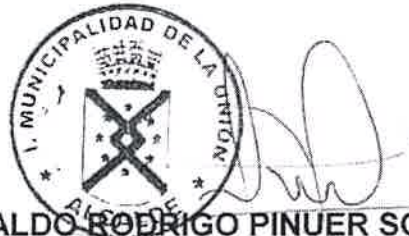
ALDO RODRIGO PINUER SOLÍS ALCALDE